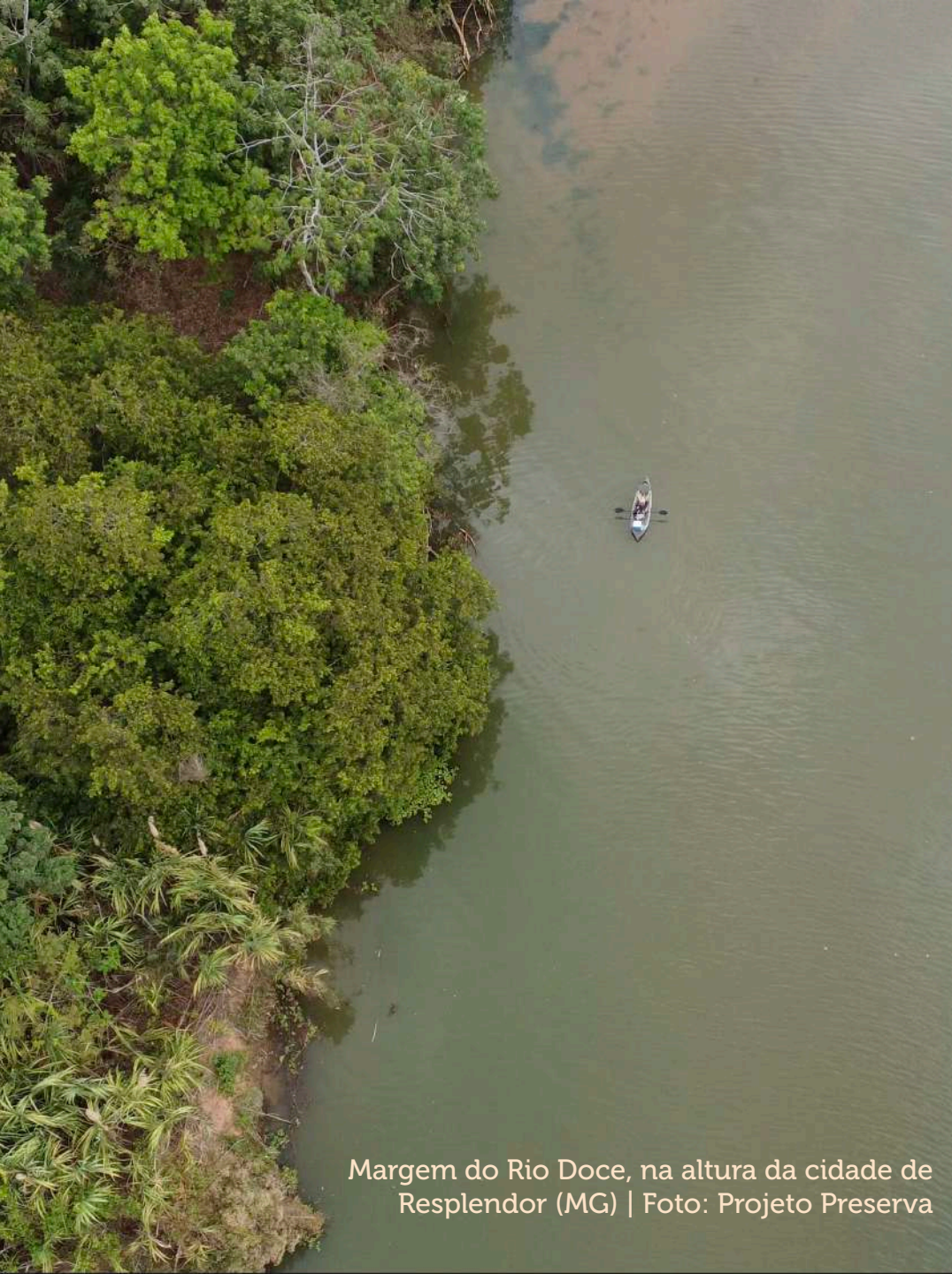
Margem do Rio Doce, na altura da cidade de Resplendor (MG)