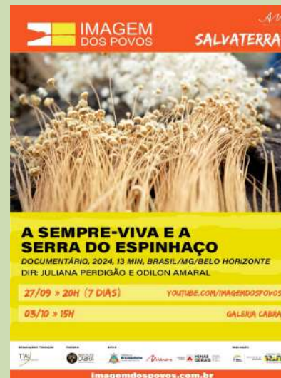
Cartaz de “A Sempre-viva e a Serra do Espinhaço”, 2º episódio da série “Projeto Preserva: Saberes Ancestrais” na Mostra “Imagem dos Povos”, em Casa Branca (Brumadinho - MG)