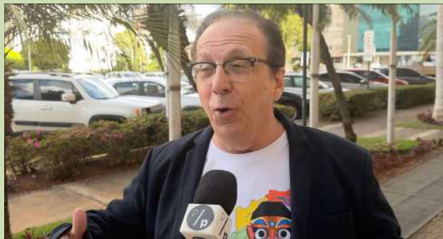
Projeto Preserva participa da cobertura do lançamento da campanha “Eu Viro Carranca para Defender o Velho Chico”, do Comitê da Bacia Hidrográfica do Rio São Francisco (CBHSF)