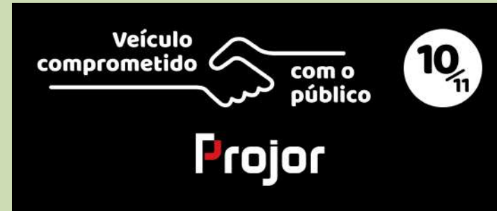
Projeto Preserva ganha Selo Projor de Compromisso com o Público