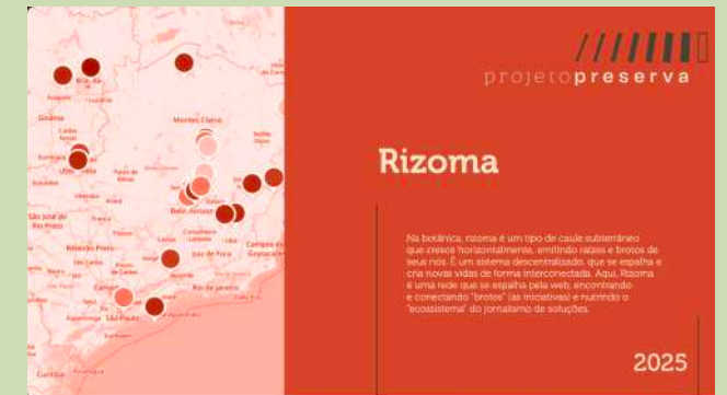
Projeto “Rizoma”, inteligência artificial para busca de iniciativas de soluções ambientais, é criado com apoio do GNI (Google News Initiative) e do Projor/Codesinfo